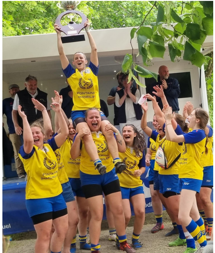
Finales Grand Ouest séniors féminines