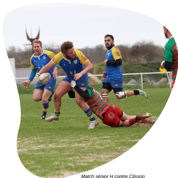
Match sénior H contre Clisson