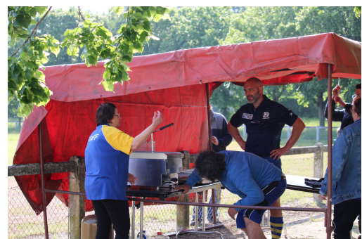
L'équipe des bénévoles en action lors des finales GO