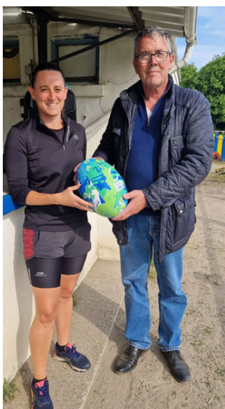
Valorisation de bénévoles par le CD72

ENGAGÉS TOUT AU LONG DE L'ANNÉE AU QUOTIDIEN ET DANS LES ÉVÉNEMENTS DU CLUB