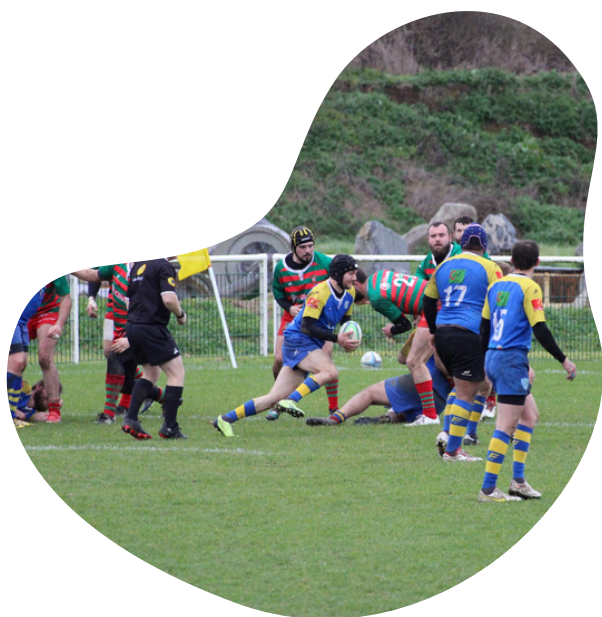
Match sénior H contre Clisson